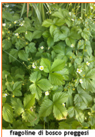
fragoline di bosco pregesi