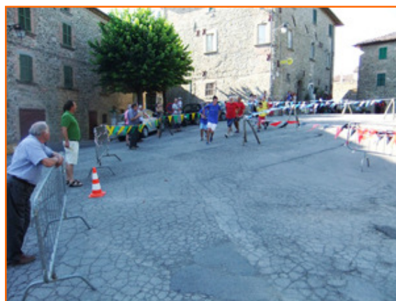
Palio delle Brocche, edizione 2012

"Poggio nel Tempo" 2013 :: programma e menù :: www.poggio.info