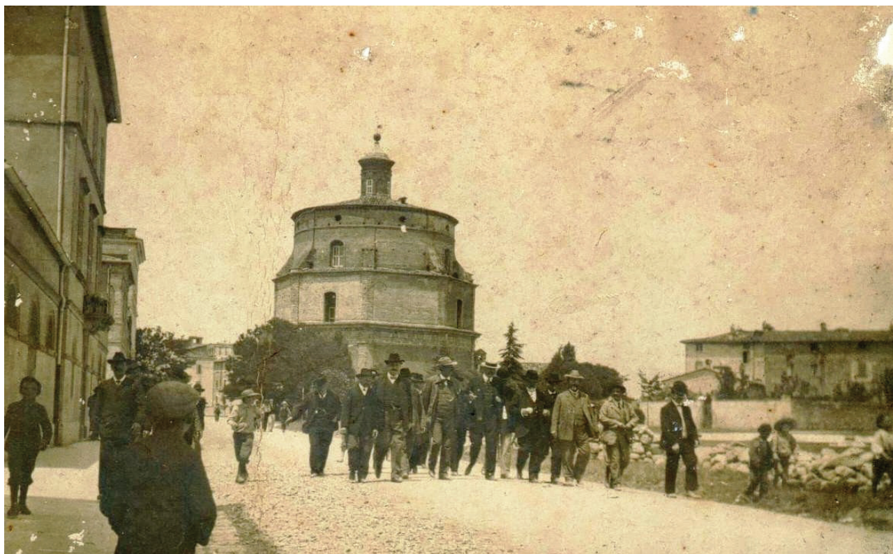
Primi del Novecento. Notabili in via Garibaldi (a destra si possono scorgere mucchi di pietre dove verrà costruito il maestoso edificio delle scuole elementari)