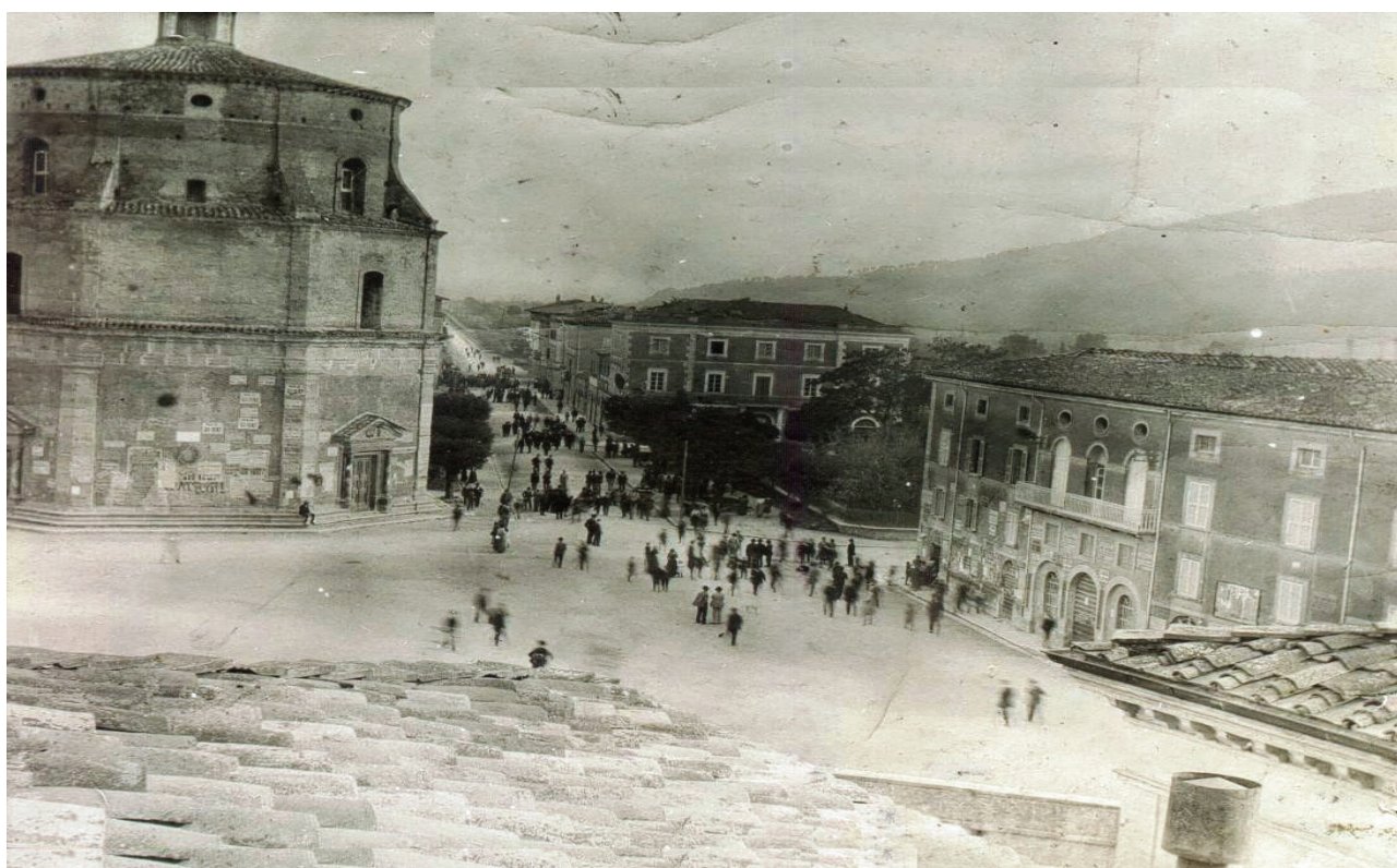
Piazza Mazzini e via Garibaldi affollate. Si possono notare manifesti elettorali anche sulla Collegiata